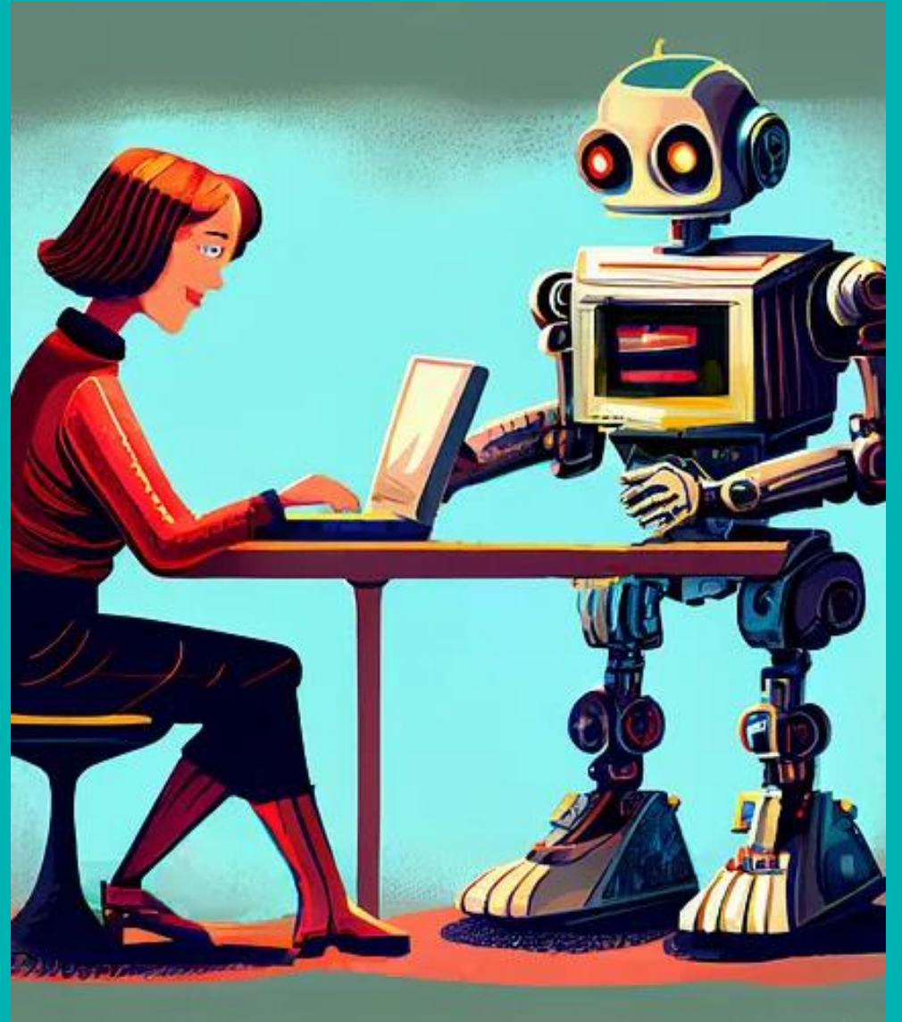
Midjourney bilde av Robert A. Gonsalves