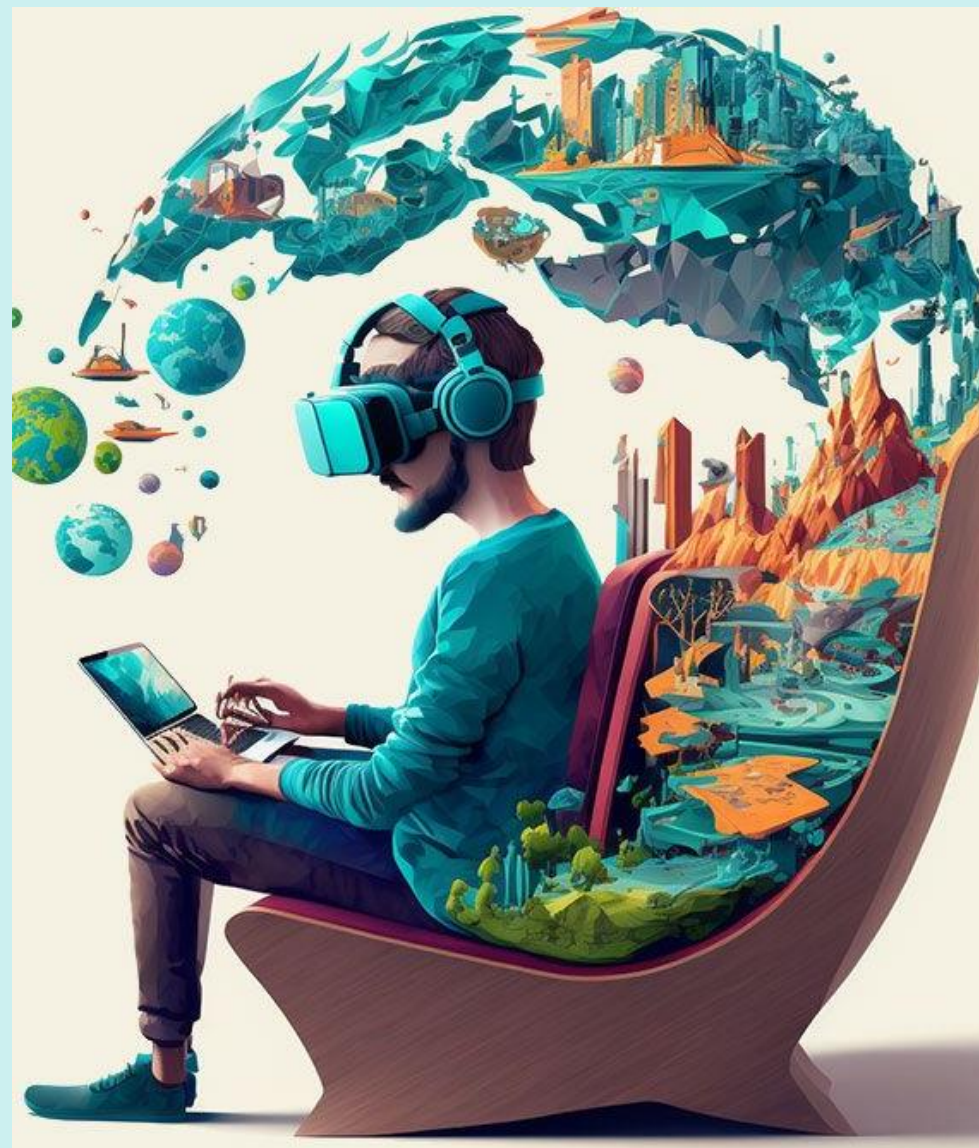
Illustration by Dr Mark van Rijmenam